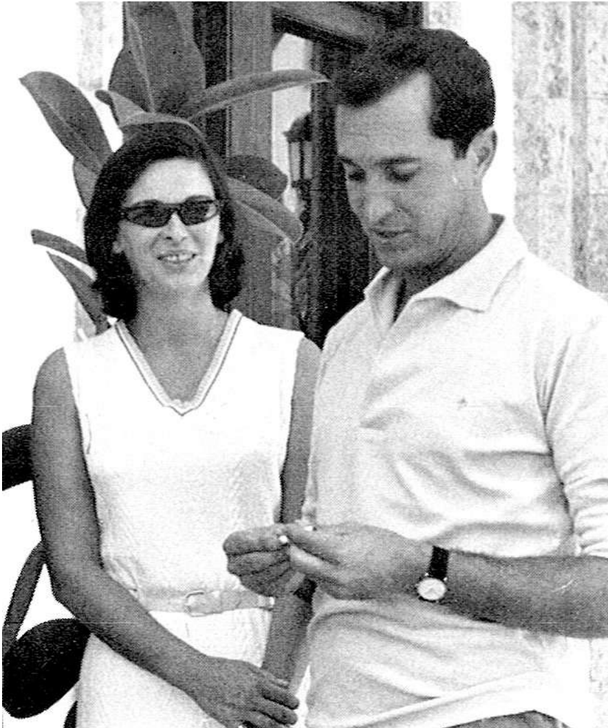
Lucía Bosé y Luis Miguel Dominguín