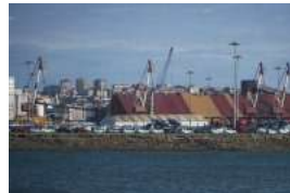
Los estibadores y la patronal se reúnen para evitar la huelga