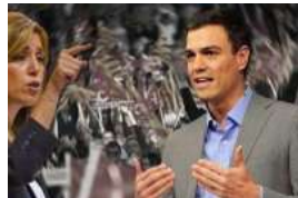
Sánchez ve riesgo de involución en el PSOE y Díaz se cree salvadora