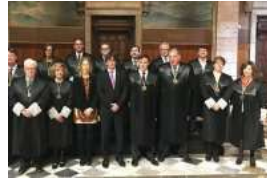
Los abogados de la Generalitat no pueden usar el castellano