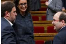
¿Iceta pedirá la cabeza de Junqueras ?