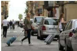
Boicot a los turistas en Mallorca a través de un 'carril guiri'