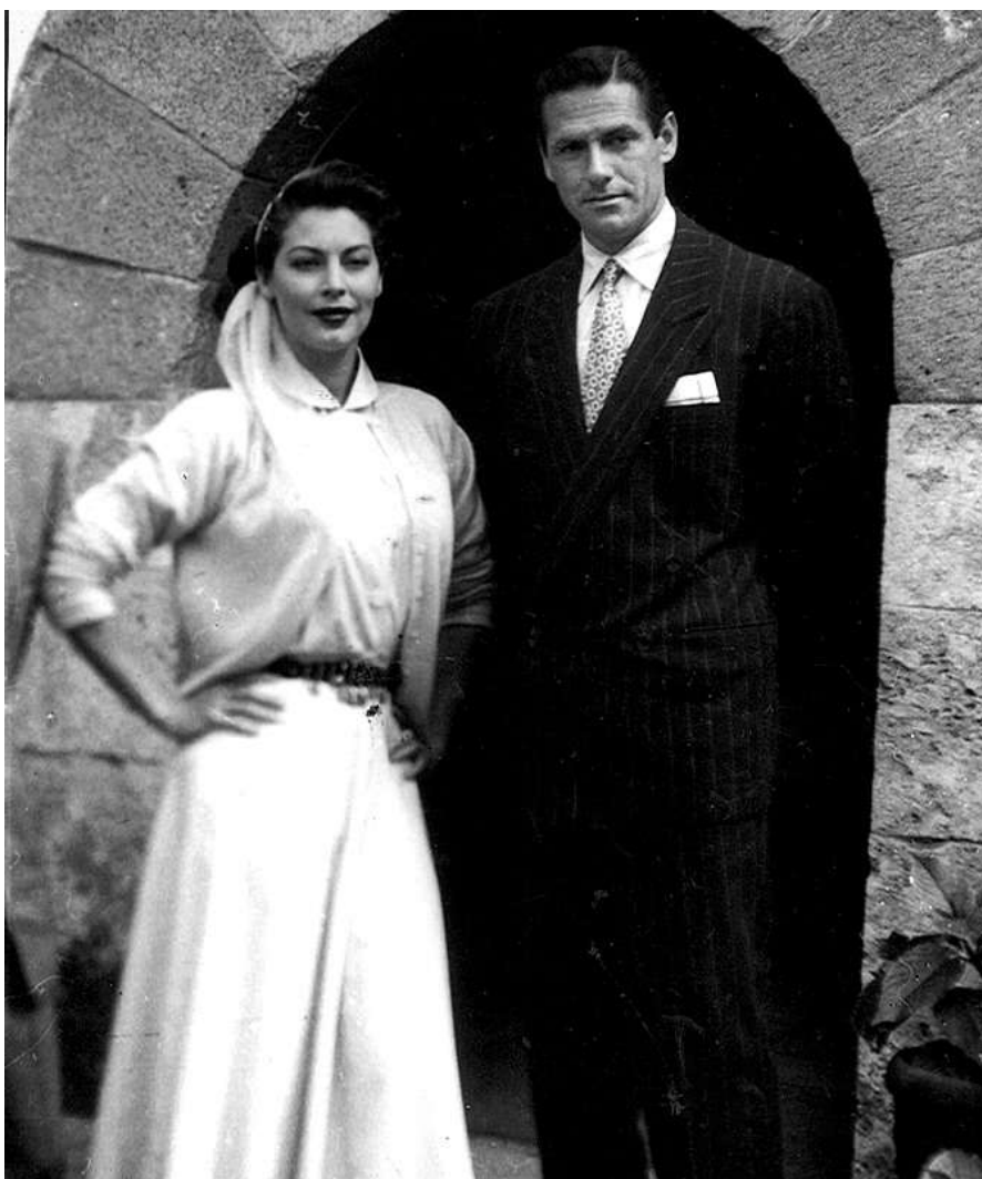
Ava Gardner y Mario Cabré

Desfilaron por el hostal las principales estrellas de Hollywood de los años cincuenta, como Elisabeth Taylor , protagonista por esas fechas de De repente el último verano ; Ava Gardner y su amante, el torero Mario Cabré, que se habían conocido en el rodaje de Pandora y el holandés errante , y Orson Welles, que en esa época dirigía Mr. Arkadin . En todas esas películas aparece la Costa Brava como escenario. Después llegarían Peter Sellers, Sean Connery, Jack Nicholson, Robert de Niro y, más recientemente, Lady Gaga o Santana.