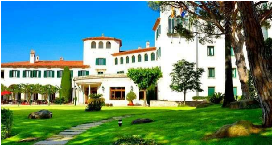
La Gavina, el cinco estrellas de S'Agaró

MARÍA JESÚS CAÑIZARES > @MJesusCanizares