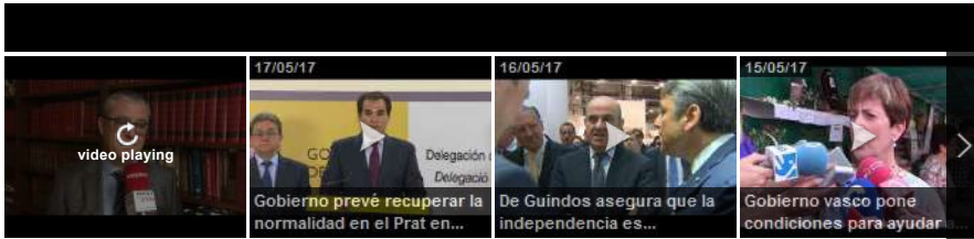
Video Smart Player invented by Digiteka

http://cronicaglobal.lespanol.com/creacion/hostal-catalan-lady-gaga_73449_102.html