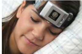
Aprender inglés rápido Cualquier idioma extranjero en 2 semanas es posible!