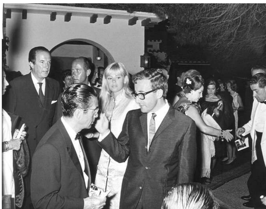
Peter Sellers y Britt Ekland

Ha pasado más de medio siglo desde aquella época dorada, pero el hostal